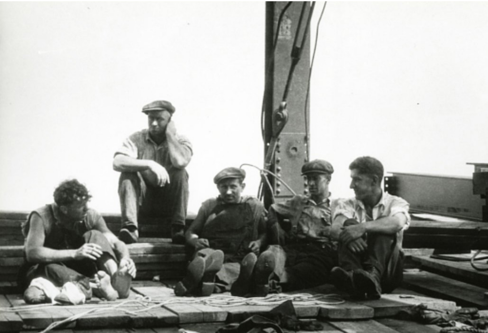
Travailleurs de l'acier Kanien'kehà:ka au travail sur le Chrysler Building