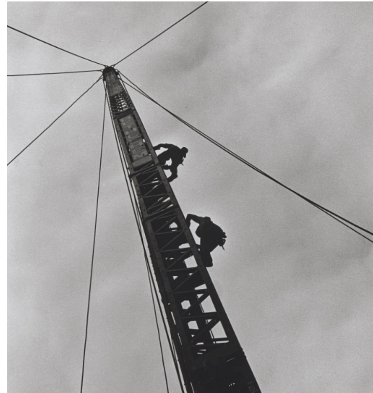
Travailleurs de l'acier Kanien'kehà:ka sur Park Avenue