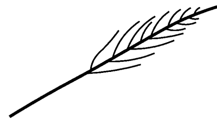
Feuille de sauge