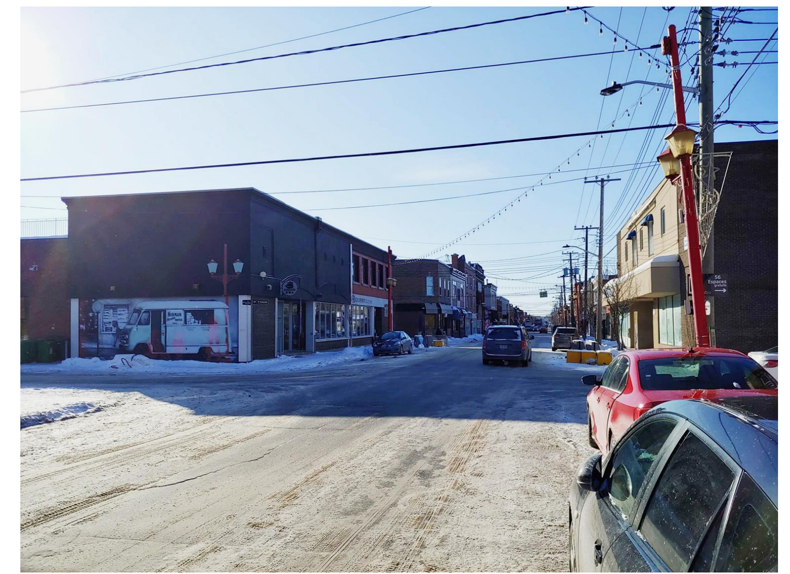
Circulation automobile prédominante (2020)