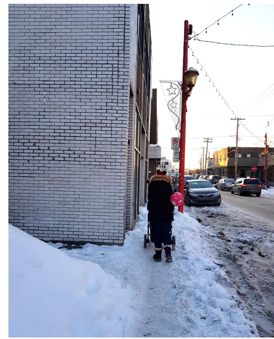
Mobilité déficiente (2020)