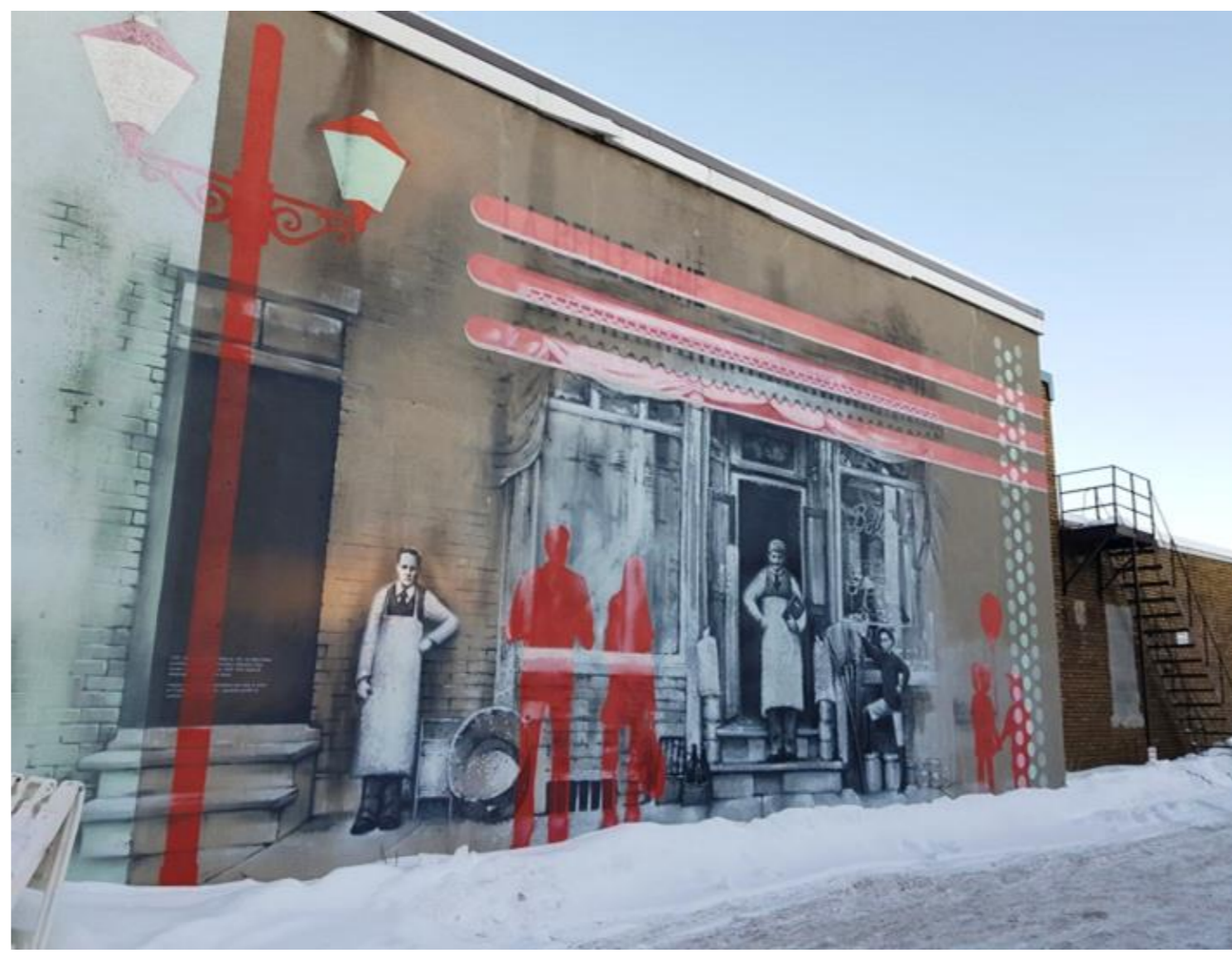
Fresque patrimoniale (2020)